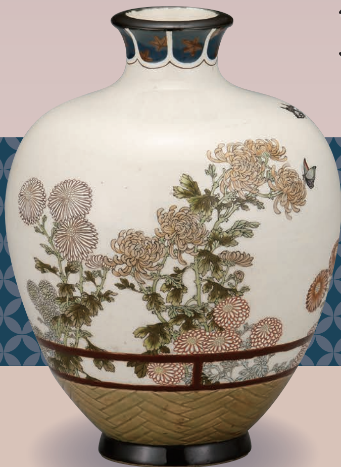
錦光山宗兵衛《上絵菊蝶図花瓶》 明治時代中期～大正時代

ミュージアムコレクションは、市民ギャラリー栄で近隣の美術館の作品を展示・紹介し、市民の皆様の美術を楽しむ機会を増やすことを目的としています。今回は、新栄にある横山美術館をご紹介します。