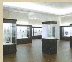
横山美術館 展示室