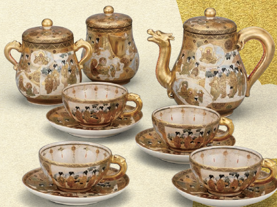
京薩摩(京都)「上絵金彩人物図ティーセット」

明治維新を契機にして、煌びやかな金彩を施した鹿児島の薩摩焼は、外貨獲得のための重要な輸出品として位置づけられます。海外で好評を博した薩摩焼は京都や東京、横浜など多くの産地でもつくられるようになり、京薩摩や横浜薩摩など各地で生まれた絢爛豪華なやきものは「SATSUMA」と呼ばれ盛んに輸出されました。本企画展では、明治・大正時代に鹿児島をはじめ長崎、京都、金沢、東京、横浜など各地で生み出され、海を渡って人々を魅了した煌めく薩摩焼の名品を紹介いたします。