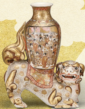
横浜薩摩「上絵金彩獅子花瓶」