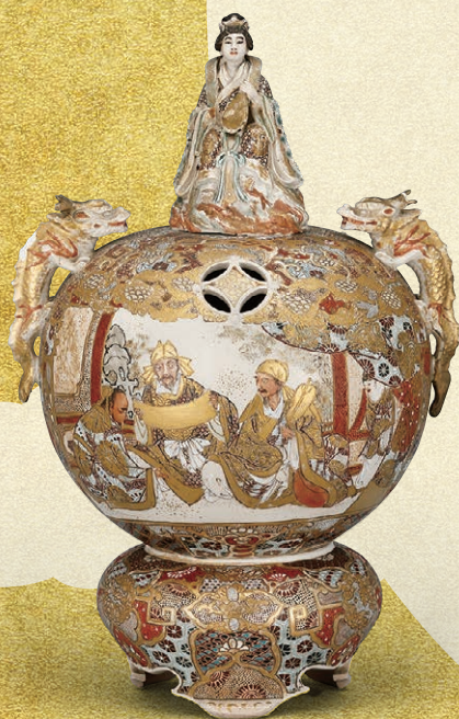
東京薩摩「上絵金彩人物図香炉」