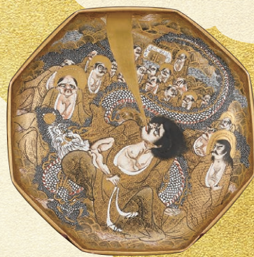
長崎薩摩「上絵金彩人物図飾皿」