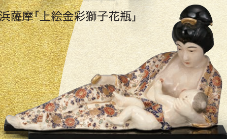
本薩摩(鹿児島)「上絵金彩母子像」