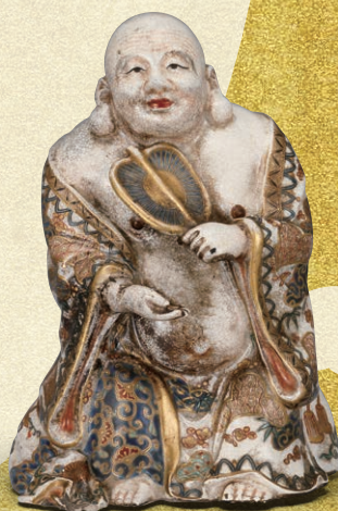
本薩摩(鹿児島)「上絵金彩布袋像」

明治維新を契機にして、煌びやかな金彩を施した鹿児島の薩摩焼は、外貨獲得のための重要な輸出品として位置づけられます。海外で好評を博した薩摩焼は京都や東京、横浜など多くの産地でもつくられるようになり、京薩摩や横浜薩摩など各地で生まれた絢爛豪華なやきものは「SATSUMA」と呼ばれ盛んに輸出されました。本企画展では、明治・大正時代に鹿児島をはじめ長崎、京都、金沢、東京、横浜など各地で生み出され、海を渡って人々を魅了した煌めく薩摩焼の名品を紹介いたします。